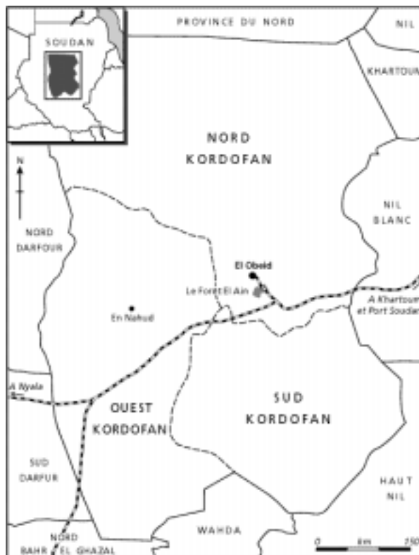
Carte 1: L'état du Nord Kordofan

Notre histoire a pour décor la zone qui se situe autour de la forêt El Ain, à 26 km à l'est de la ville d'El Obeid dans l'état du nord Kordofan (voir carte). Cette région est caractéristique de la zone sahélienne avec sa faible pluviométrie (350 mm/an) qui varie considérablement dans le temps et dans l'espace. Environ 90 % de ces pluies tombent entre juillet et septembre.